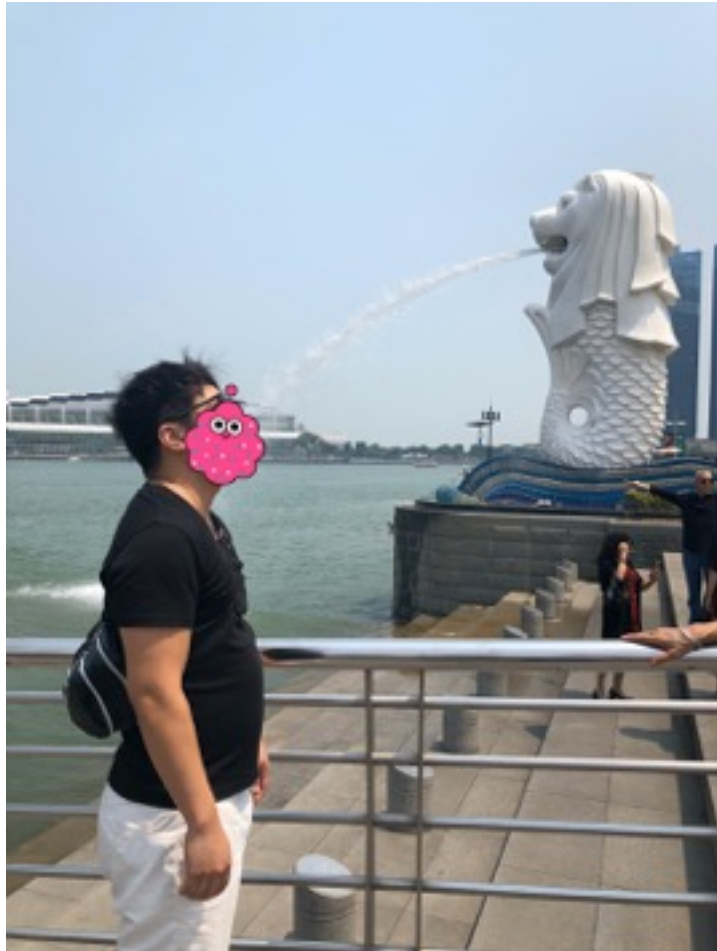
2019年9月 80キロ（過去最高体重）

僕自身もともとは稼いでからは10キロ以上太りました。 そしてだらしない身体をしていました。